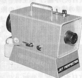
高性能噴霧機「ジェットパーフェクター」