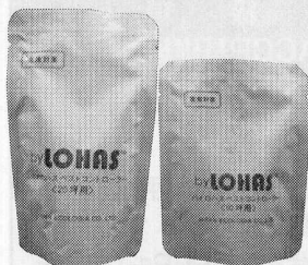
PCOシステム液剤「バイロハスベストコントロール」10坪用(500ml分)と20坪用(1000ml分)

本製品の有効成分であるニームオイルおよびアザディラクチンは、昨年より実施されているポジティブリスト制度で「人の健康を損なう恐れのないことが明らか」で厚生労働大臣が指定する65物質のリス